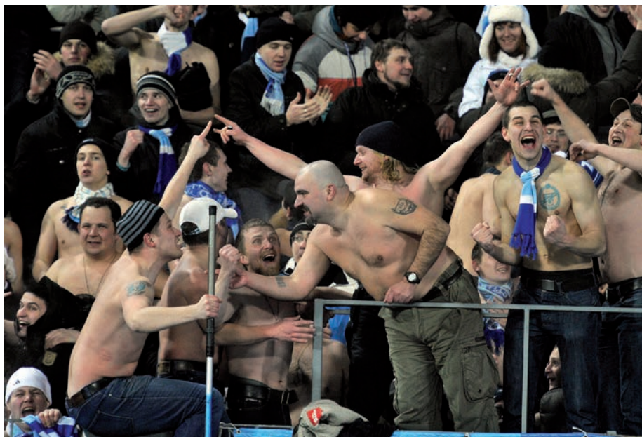
Sociale normen sturen het gedrag van individuen. Deze foto toont 'voetbalsupporters' van Zenit Sint-Petersburg, een groep die geweld en racisme niet schuwt.

Een vorm van onderzoek waarbij de onderzoeker controle heeft over de gebeurtenissen en deelnemers volkomen toevallig aan condities worden toegewezen.